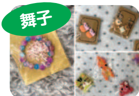
ビーズ製品・イヤリングなど