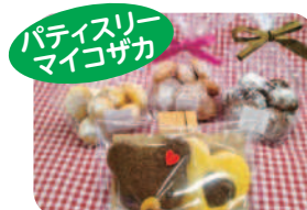
クッキー(ギフトも可)

各事業所での作業です。質の良い商品づくりを心がけています。自慢の商品ですので、ご注文があれば是非お願いします。