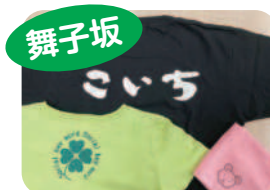
プリントエプロン、Tシャツ、タオルなど