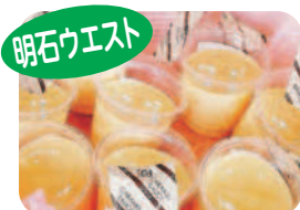
プリン・ドーナツ・クッキー (ギフト用も可)