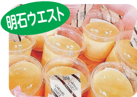
プリン・ドーナツ・クッキー(ギフト用も可)