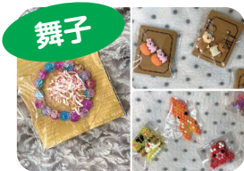
ビーズ製品・イヤリングなど