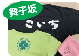
プリントエプロン、Tシャツ、タオルなど