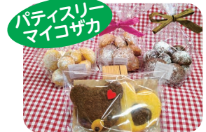
クッキー(ギフトも可)

各事業所での作業です。質の良い商品づくりを心がけています。自慢の商品ですので、ご注文があれば是非お願いします。