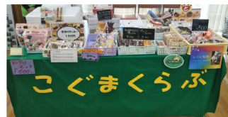
わくわくオータムフェスタにて 2024年10月26日