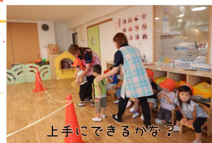
上手にできるかな？