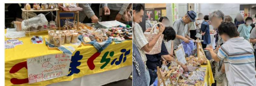
たるみ生き活き保健福祉フェアにて 2024年10月2.3.4.6日