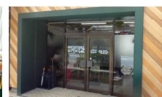
明石ウエスト事業所 定員20名 明石市本町2-6-3 綱岡ビル1階 TEL:078-939-2650