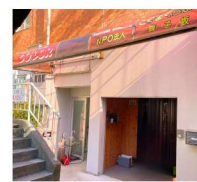
舞子坂事業所 定員40名 神戸市垂水区舞子坂3-17-5 第3春名ビルB1 TEL:078-220-6458