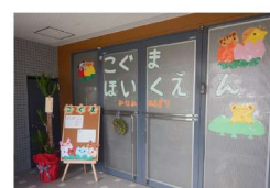
南朝霧園 定員30名 明石市朝霧南町3-1-35 セラーン朝霧2F TEL:078-915-8001